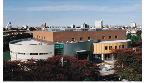
(写真：日本大学文理学部百周年記念館)