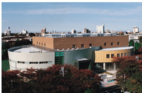
(写真: 日本大学文理学部百周年記念館)